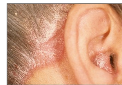
Bilder på psoriasis.

med kallt klimat och med långa avstånd till den kvalificerade hudsjukvården är klimatvården en angelägen vårdform.