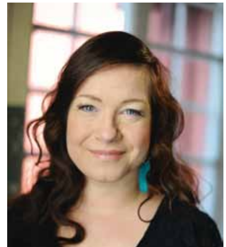
Lena Maria Klingvall.

I kyrkan fick vi uppleva en helt fantastisk föreställning och konsert av och med konstnären och sångerskan Lena Maria Klingvall. Lena Maria är en otroligt varm och generös medmänniska som har en sångröst som får alla mina sinnen att rysa av välbehag. Hon avslutade föreställningen med låten "You Raise Me Up" som är skriven av Rolf Lovland och Brendan Graham. Då ångrade jag att jag inte tog med mig en hel förpackning av pappersnäsdukar.