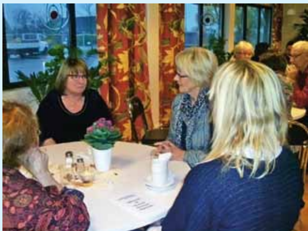
Medlemmar i samtal på Rännkrogen

Ett 30-tal av våra medlemmar slöt upp för att bevisa årets julkonsert som hölls söndagen 18 november kl 17.00 i Hjärnarps Kyrka. Innan föreställningen samlades deltagarna i Rännkrogen på Lindab Profil.