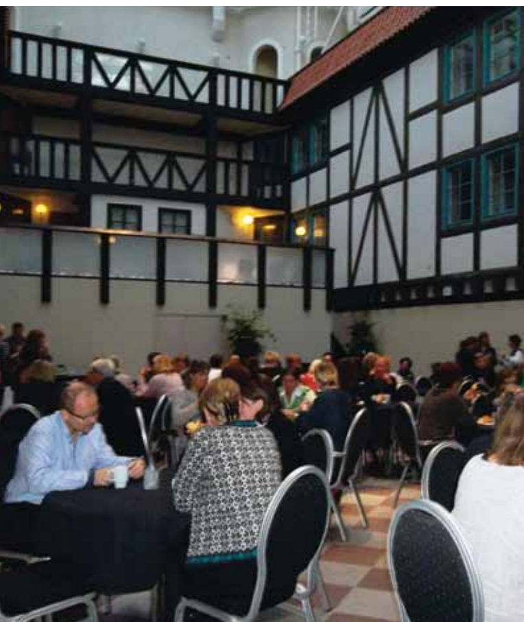
Fikapaus med erfarenhetsutbyte

Det var nästan tre år sedan den förra utbildningen hölls. Det var många, över 100 anmälda, både nya terapeuter och de som deltagit tidigare. Förkylning och maginfluensa satte stopp för ett 10-tal men ett 90-tal fotterapeuter har lärt sig lite mer och kan förhoppningsvis behandla psoriasisfötter bättre.