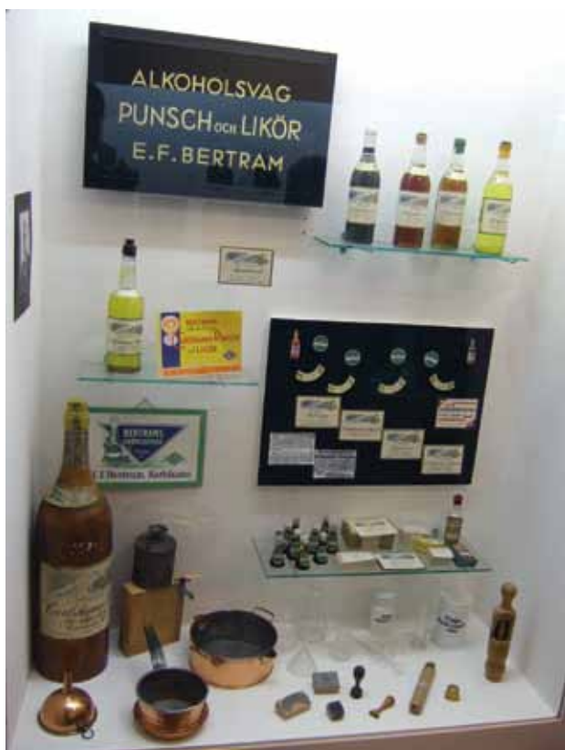
Från utfärd till bland annat Punchmuseet i Karlshamn