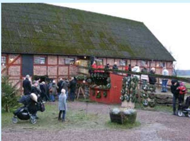
Julmarknad vid Wapnö slott.

kappvänligt och vågade därför inte delta. Vädret var inte det bästa denna dag med både regn och blåst men inne i bodarna var varmt och skönt. Alla hittade nog något passande till jul. Välkommen du med på en utflykt eller annan aktivitet 2013!