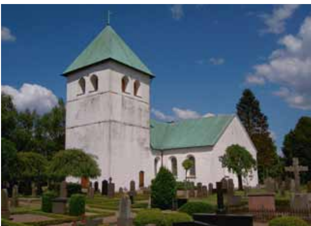
Munka-Ljungby kyrka.

Det blev en mycket intressant och givande eftermiddag. De båda föreläsarna gav oss en väldigt bra inblick i ämnesområden som för oss psoriatiker är viktiga. Vi kände oss därför mycket nöjda med dagens begivenheter när vi sedan förflyttade oss vidare till Munka-Ljungby kyrka.