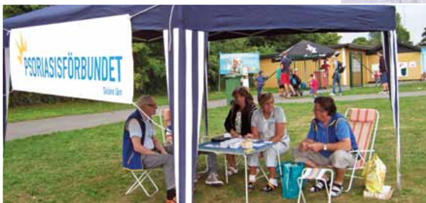
I väntan på besökarna