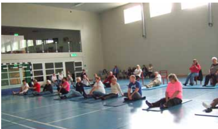
Vi fick prova på yoga