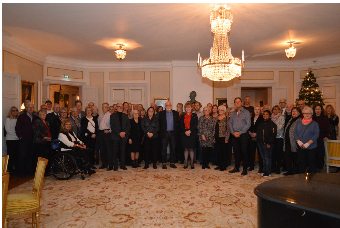
Föreläsning No. 5 2018 på Västerås slott