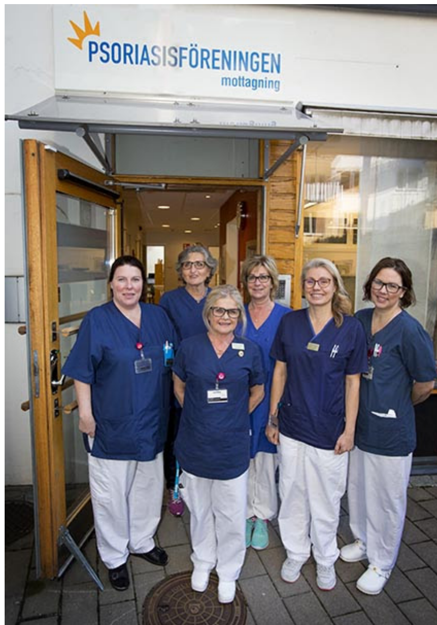
Personalen på Psoriasisförbundets mottagning i Hammarby sjöstad, Stockholm.