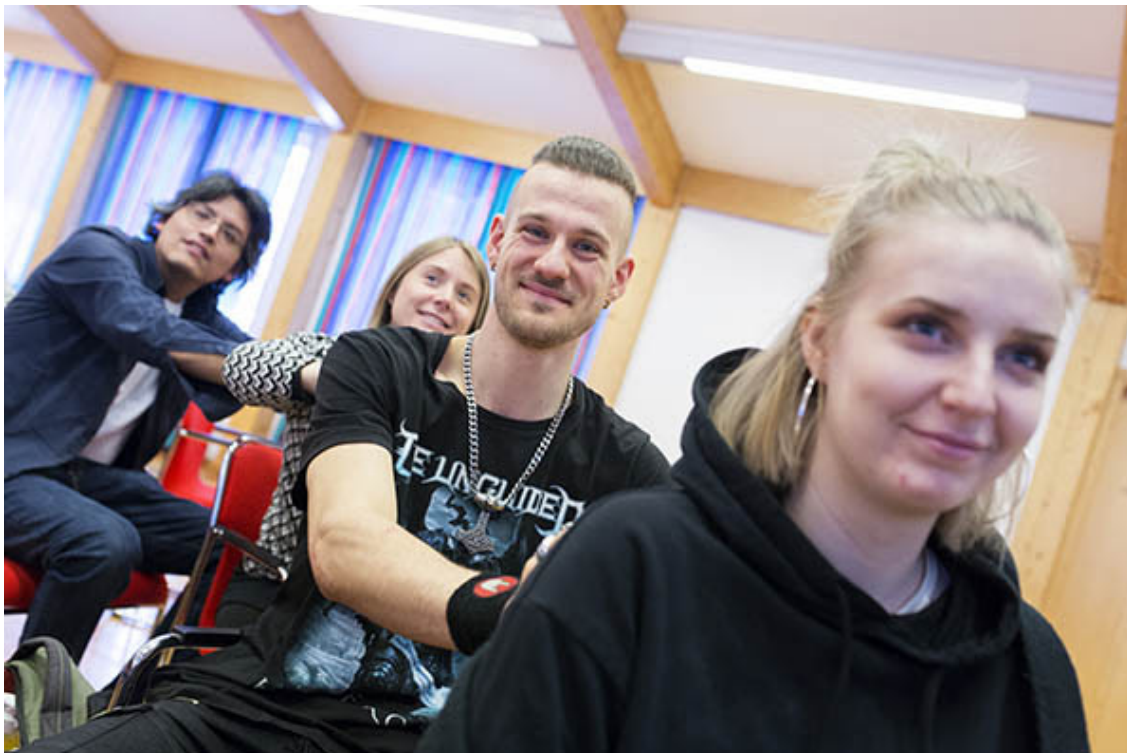
Unga medlemmar i Psoriasisförbundet träffades i Skellefteå.

Har du psoriasis och drabbas av smärta och svullnad i leder, led-, sen- eller muskelfästen, så kan det vara följsjukdomen psoriasisartrit. Se då till att kontakta vården så snart som möjligt så att du kan få en medicinsk utredning och bedömning av dina besvär. Att snabbt få rätt diagnos och effektiv behandling vid psoriasisartrit är viktigt för att undvika ledförstörelse och funktionsnedsättning. Här kan du läsa mer om vikten av tidig diagnos vid ledbesvär.