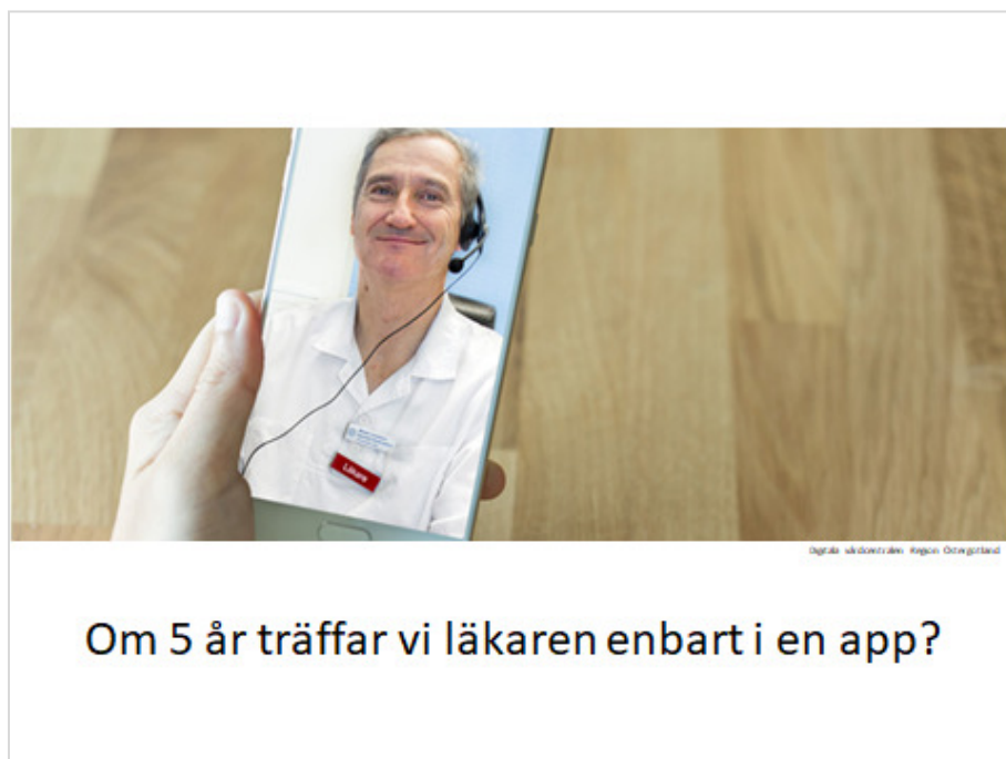
Bild 11 Provsvar kan skickas in via nätet, läkaren har digitala mottagningar etc. Hur kan vi förhålla oss till det på bästa sätt?

Bild 10: Kan vi jobba med differentierat medlemskap? Hur skulle sådana paket kunna se ut? Hur kan det bli enkelt att engagera sig i frågor man vill engagera sig i? Kan vi exempelvis samla ihop särskilda "kampanjgäng" för att driva olika sakfrågor? Hur kan en "palett" av olika aktiviteter eller ingångar till förbundet se ut i framtid?