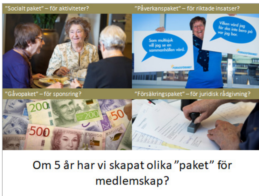
Bild 10: Kan vi jobba med differentierat medlemskap? Hur skulle sådana paket kunna se ut? Hur kan det bli enkelt att engagera sig i frågor man vill engagera sig i? Kan vi exempelvis samla ihop särskilda "kampanjgäng" för att driva olika sakfrågor? Hur kan en "palett" av olika aktiviteter eller ingångar till förbundet se ut i framtid?