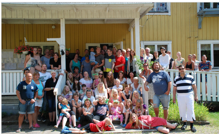
Bild 4: Hur vill dagens unga att förbundet ska arbeta eller vara organiserat? Om de skulle skriva om våra stadgar – vilka förändringar skulle de göra?

Om 5 år kan ett riksläger bli en avdelning?