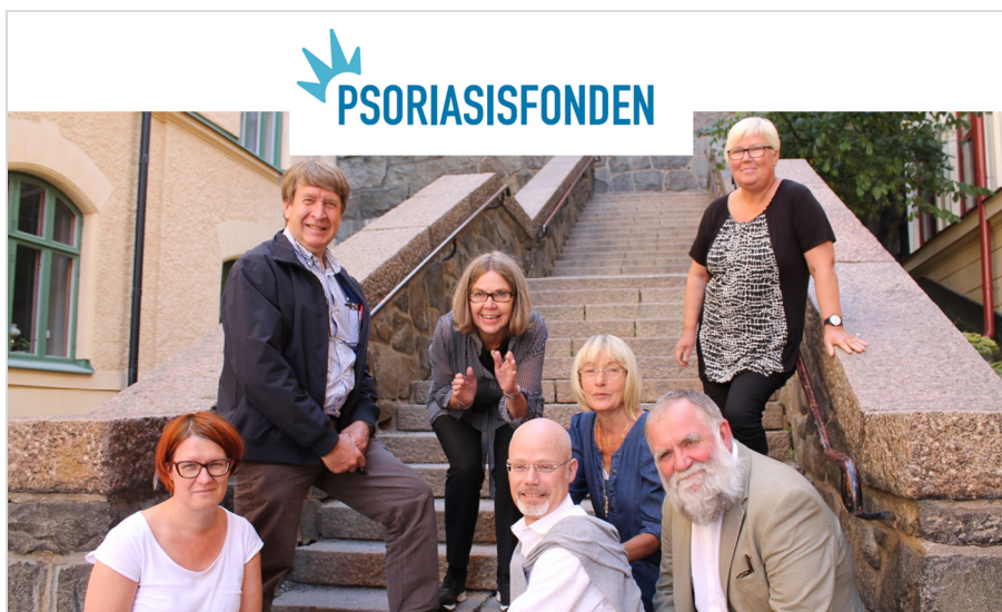
Bild 6: Digitala lösningar blir allt vanligare. Vad skall teknikutvecklingen kunna innebära för oss i förbundet? Hur kan vi nyttja sociala medier för samtal och kommunikation med medlemmar och potentiella medlemmar?