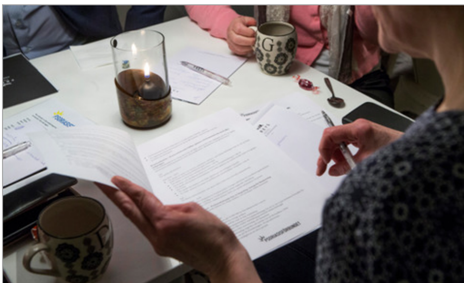
Bild 8: Fler och fler ska dela på statsbidraget som inte ökar i motsvarande omfattning. Vår egen lotteriverksamhet minskar, trots idoga insatser. Hur ska vi vara finansierade i en framtid?

Om 5 år har vi gjort det enklare att starta, driva och avveckla en avdelning?